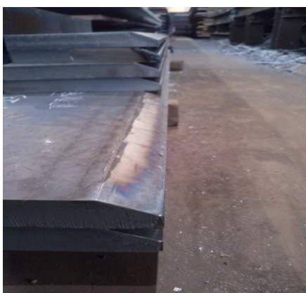
サーフィン開先(ガス)