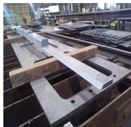
長尺開先(レーザー)